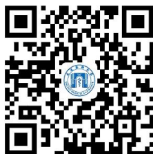
11. 研究生学位授予证书补办

11.3 办理时限：三个工作日（周一至周五 8:30-16:30，节假日和寒暑假休息）