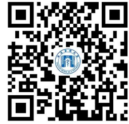
高校权力事项清单